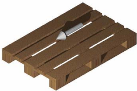
Dirección de transporte a lo largo