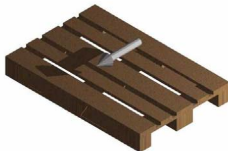
Dirección de transporte a través